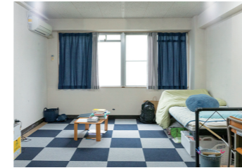
Aタイプ / 18㎡

自室を完全個室にすることでプライバシーを確保しています。毎週部屋点検を実施することで自室の清潔さを維持し、自律心の養成を行っています。