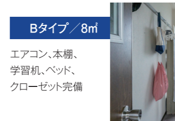
Bタイプ / 8㎡